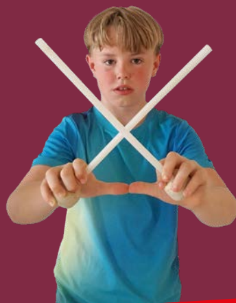
'Shula' break 2