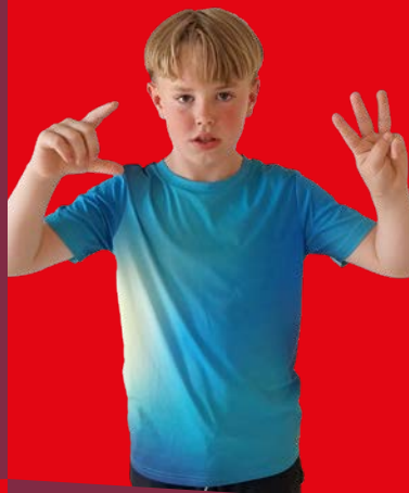
Break x 3